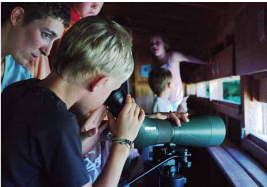
L'observation directe du martin-pêcheur est un moment-clé du processus de sensibilisation des visiteurs à la vie sauvage.