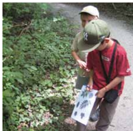
Le plaisir de pouvoir reconnaître les arbres (module forêt).

Durant l'été, 35 enfants et adolescents ont pris part aux deux camps. Le pre-