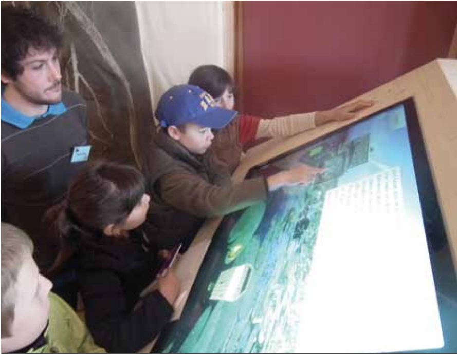
La nouvelle exposition «Le retour de la tortue cistude» sensibilise à la réintroduction possible de notre seule tortue indigène.

Une activité de découverte de la réserve naturelle de Cudrefin a été agendée dans le cadre de « La fête de la nature » organisée par « La Salamandre ».