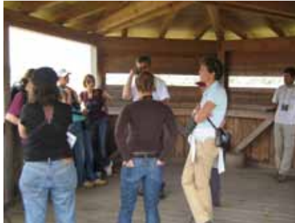
Les participants à la formation ECOFOC ont découvert l'accueil des publics dans des sites protégés.

L'Office Fédéral de l'Environnement, la commune de Cudrefin, le conseil municipal de Chêne-Bougeries, le groupe DACH (responsables nationaux protection de la nature d'Allemagne, d'Autriche et de Suisse), les enseignants de la Haute Ecole Pédagogique BEJUNE, les étudiants de la