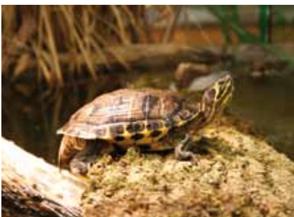
L'exposition présente la problématique du commerce des espèces sauvages (ici une tortue américaine).

Le centre a participé aux journées internationales des migrations début octobre. La découverte des oiseaux en halte au bord du lac et leur baguage à La Sauge a permis de sensibiliser de nouvelles personnes.