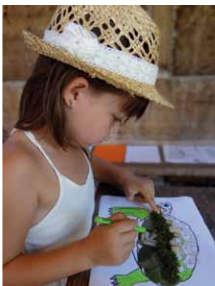
L'atelier bricolage a su séduire petits et grands.