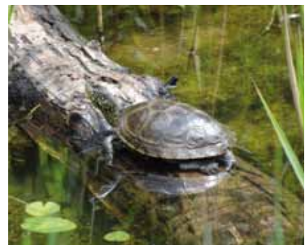
Durant la belle saison, les tortues cistudes adultes ont pu profiter de l'étang didactique.

Un module d'exposition consacré au pic noir, oiseau de l'année 2011, a été installé dans la grande salle.