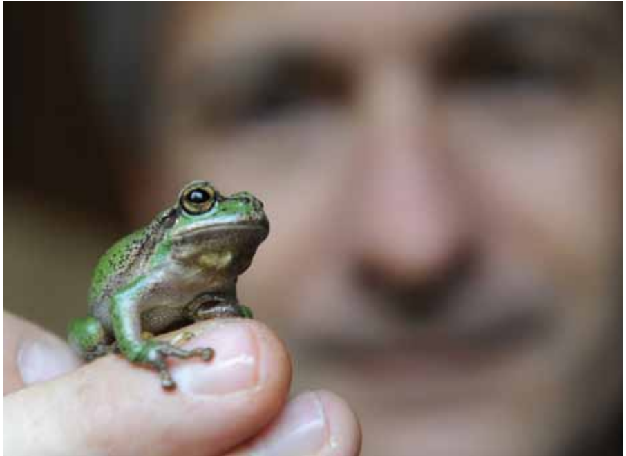
Le nombre de rainettes a considérablement chuté cette année en raison de la sécheresse persistante.

Les travaux d'entretien ont été conduits grâce notamment à la collaboration d'un groupe de l'Association bernoise de protection des oiseaux, de