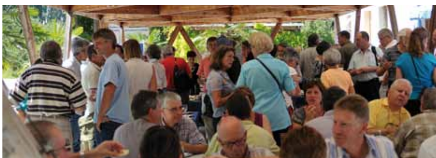
Les invités à la partie officielle se pressent devant l'auberge.