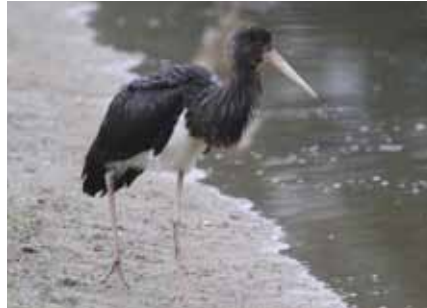
Une jeune cigogne noire en visite.

Parmi les hérons, 2 crabiers chevelus ont chassé les courtilières sur les bords des étangs entre le 21 avril et le 28 mai. Les aigrettes garzettes ont été peu vues (3 le 21 avril). Des hérons pourprés ont séjourné les 30 avril, 14 juillet et 7 août. Deux jeunes cigognes