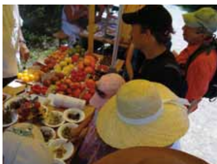
Une bourse aux tomates a permis de présenter des variétés peu connues.