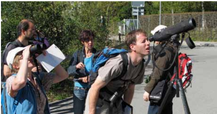
Les participants de la formation romande en ornithologie ont pu développer leur passion des oiseaux.

Le centre-nature entretient des collaborations étroites avec les médias. 140 articles de presse, interviews et reportages ont été consacrés à nos activités en 2011.