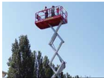
Une nacelle élévatrice permettait de découvrir l'ensemble du site de La Sauge.