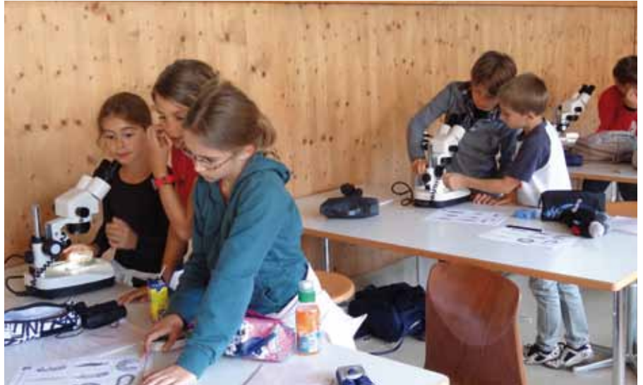
Les animations ont permis aux groupes et classes de comprendre l'importance de la diversité du vivant.

Notre gratitude va aussi à la Fondation J.P. Schnorf, propriétaire, ainsi qu'au personnel de l'Auberge de La Sauge,